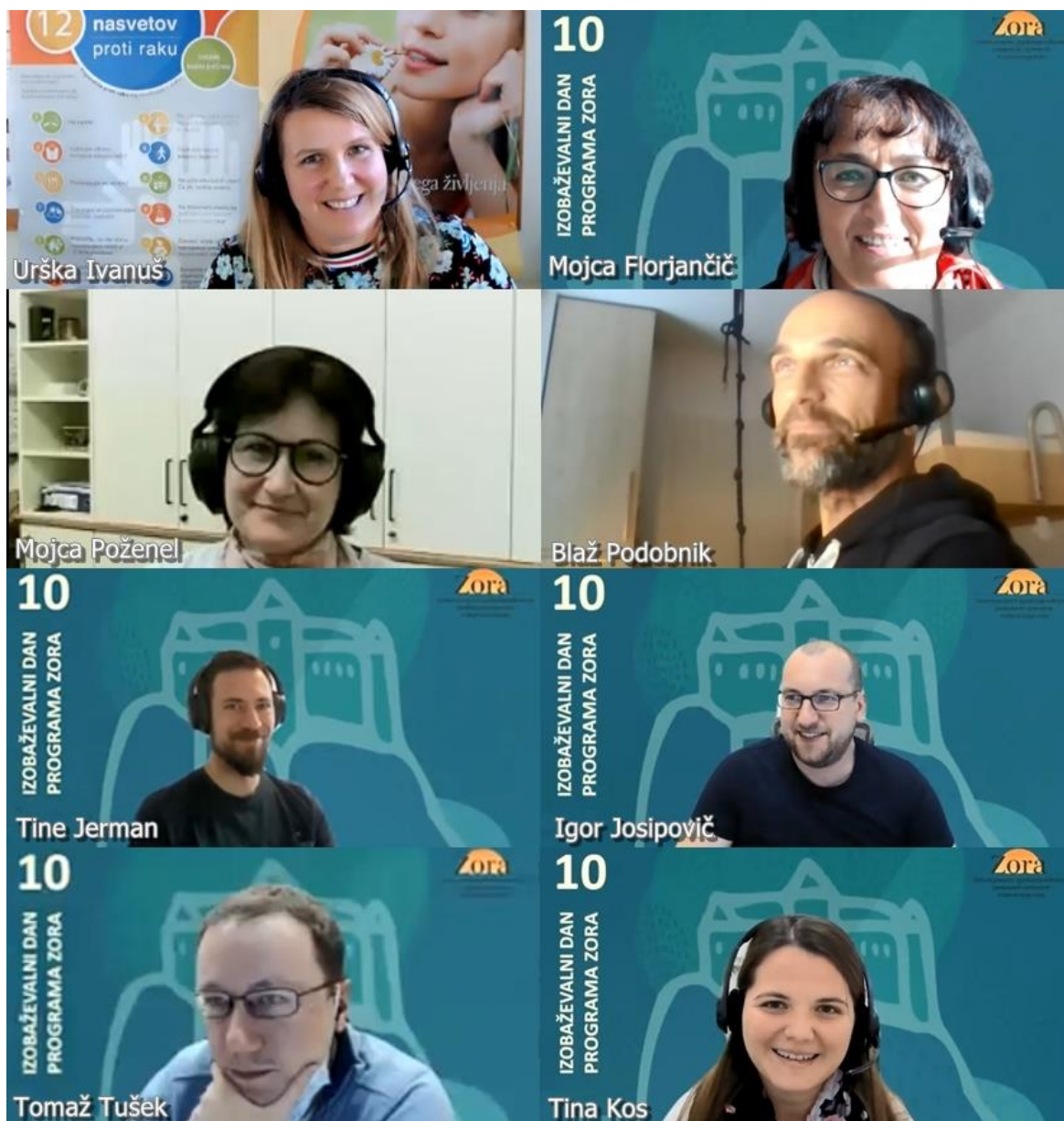
Slika 2. Ekipa s sedeža programa ZORA, ki je poskrbela za organizacijo in nemoten potek dogodka.