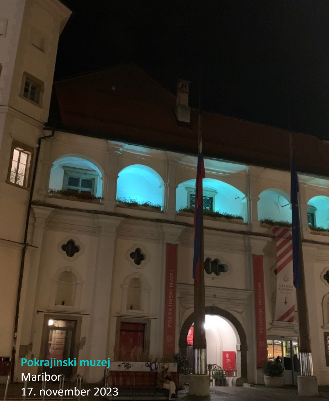
Pokrajinski muzej Maribor 17. november 2023